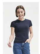
SOL'S MISS 11386